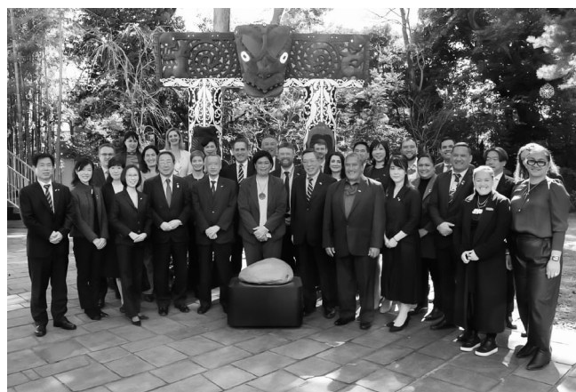
レセプション参加者全員集合